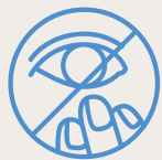
Gesicht und vor allem Mund, Augen und Nase nicht mit den Fingern berühren