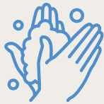
Regelmäßig Hände mit Seife oder alkoholhaltigem Desinfektionsmittel waschen