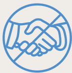
Händeschütteln und Umarmungen vermeiden