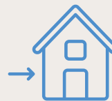
Bei Anzeichen von Krankheit zu Hause bleiben