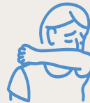
In Armbeugen oder Taschentuch niesen, Taschentuch entsorgen